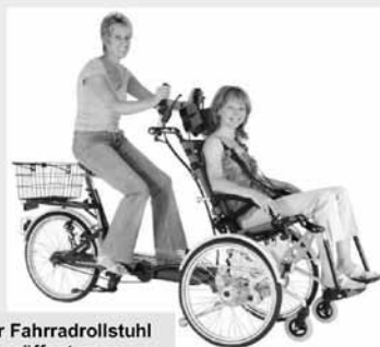
Der Fahrradrollstuhl eröffnet neue Möglichkeiten